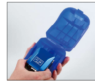
付属ハードケース