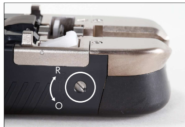
[R]選択時=刃自動回転 [O]選択時=刃非回転(固定)