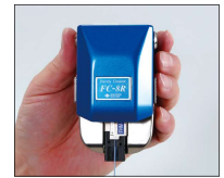
ファイバホルダをバネでしっかり ホールド、強く振ってもズレ、落下 の心配なし。