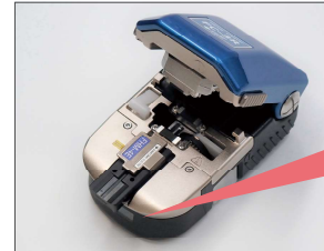
ファイバホルダ装着時のみカウンタ作動。