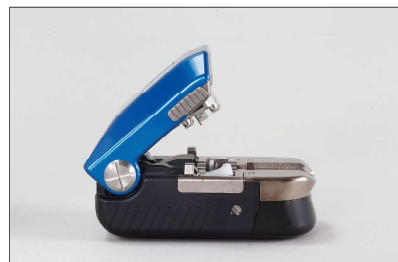
①方向=開閉角度「標準」